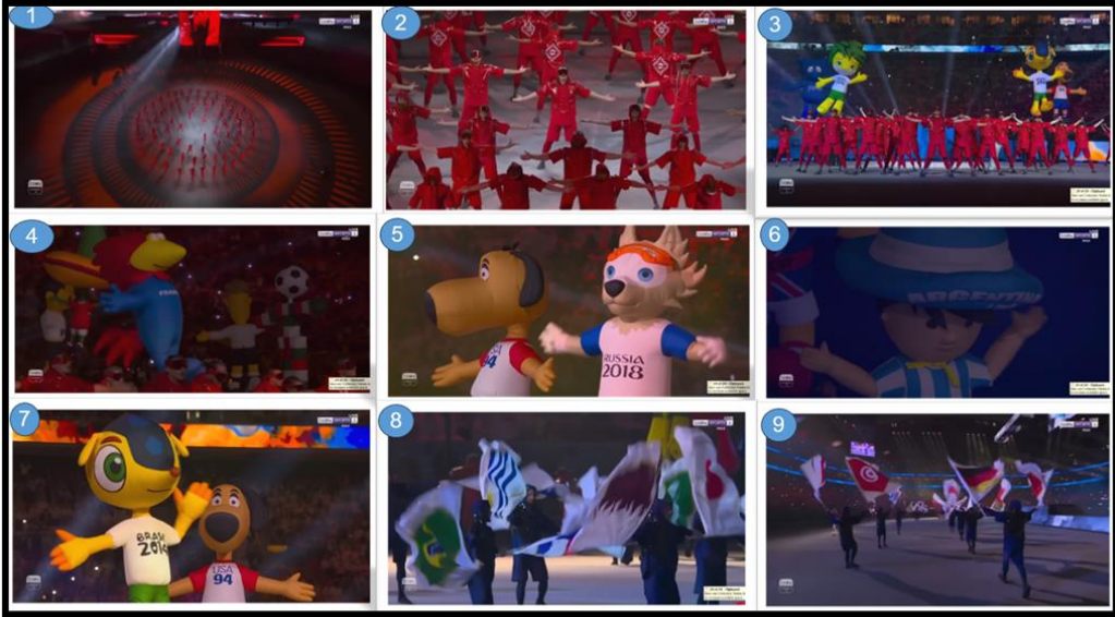
لقطات الشاشة للعرض الرابع من فيديو حفل الافتتاح