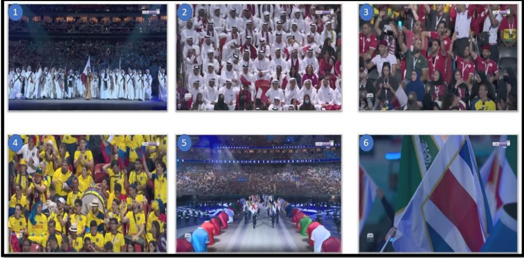
لقطات الشاشة للعرض الثاني من فيديو حفل الافتتاح