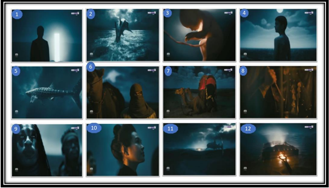
لقطات الشاشة للعرض الأول من فيديو حفل الافتتاح