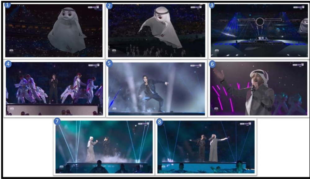
لقطات الشاشة للعرض الخامس من فيديو الافتتاح

● التعريف بالعرض الخامس وبالموارد السيميائية في محتواه جاء العرض الخامس من الافتتاح باسم "حالمون"، حيث كان المورد البصري السمعي لهذا العرض "لعيب" وهي تعويذة قطر لكأس العالم 2022 تتصدر المشهد (صورة 1-2) حيث كان مرفرفاً خفياً في سماء الملعب؛ لإظهار قدرته الخاصة بالانتقال بين الأزمنة، والذي يمر عبر ذكريات البطولة السابقة، متحدياً أبعاد الزمان والمكان، كما اكتمل العرض ببدء عرض غنائي موسيقي راقص لأغنية Dreamers (حالمون)، وهي أغنية أداها كل من المطرب القطري فهد الكبيسي والفنان الكوري جونج كوك من BTS (صورة 3:8)،