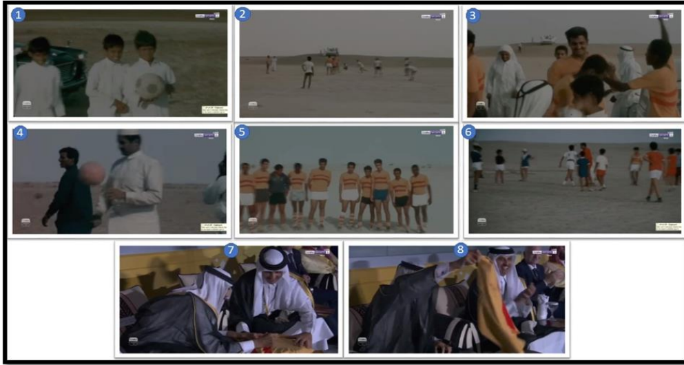
لقطات الشاشة للعرض السادس من فيديو الافتتاح