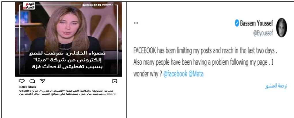
شكل (1) نماذج من إعلاميين وصناع محتوى تعرضوا لتقييد حساباتهم من قبل شركة Meta نتيجة دعمهم لطوفان الأقصى