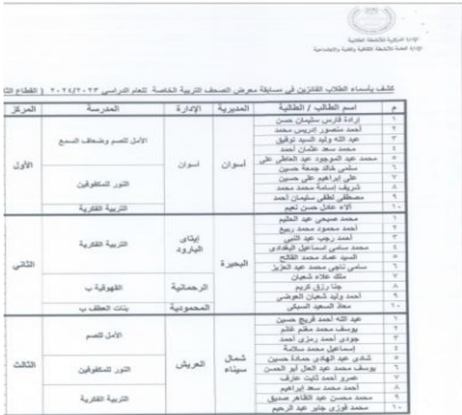
شكل (1) يوضح أسماء طلاب جماعة النشاط المدرسي بمحافظة أسوان الفائزين

جهداً تجاه الأنشطة المكلفين بها، ويسعون بشكل مستمر لتحسين مستوى أدائهم، ويحرصون على أداء الأنشطة الإعلامية بجدية تامة، ويشعر الطالب من خلال مشاركته في تلك الأنشطة أن لديه القدرة على تحمل المسؤولية واتخاذ القرار، والتخطيط الجيد لمستقبله. وظهر ذلك من خلال نتائج طلاب جماعة أنشطة الإعلام المدرسي بمحافظة أسوان، حيث حصد الطلاب المركزين الأول والثاني على مستوى الجمهورية للعام الدراسي 2024/2023م، في مسابقة معرض صحف التربية الخاصة، والتحقيق الصحفي.